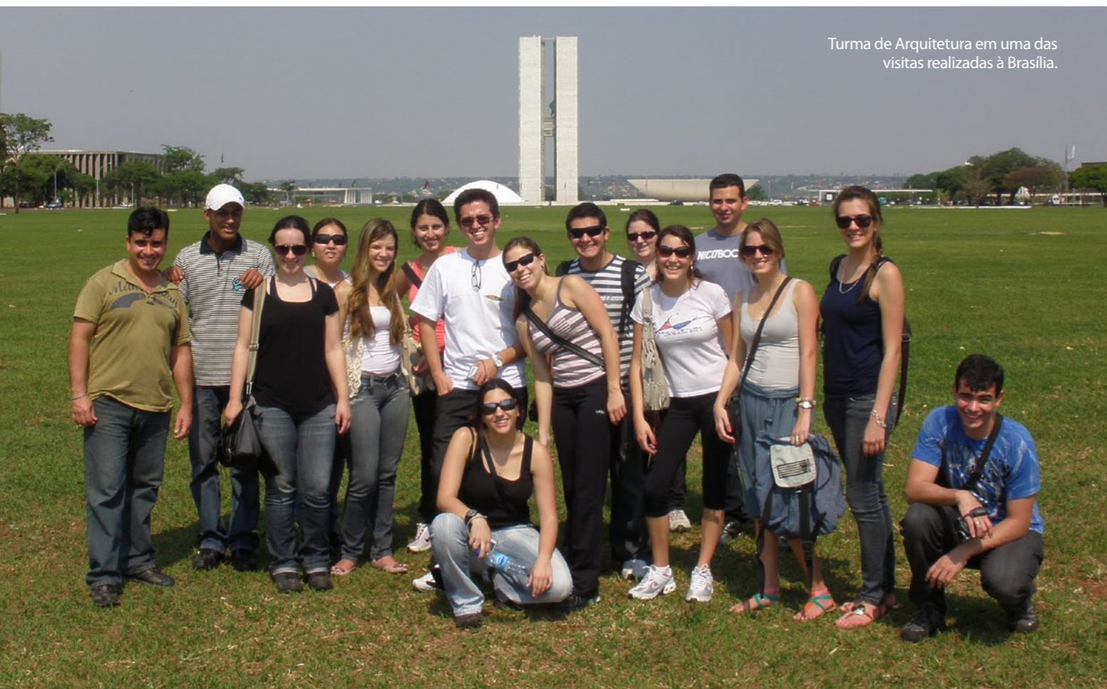
Turma de Arquitetura em uma das visitas realizadas à Brasília.

Ela conta que, com esta iniciativa, também já conheceu obras arquitetônicas de São Paulo, Belo Horizonte/Ouro Preto, Brasília e Curitiba. “Acho extremamente importante o arquiteto ter uma visão real dos locais e projetos para que seu repertório se estenda e para que ele cresça cada vez mais como um profissional competente”, finaliza.