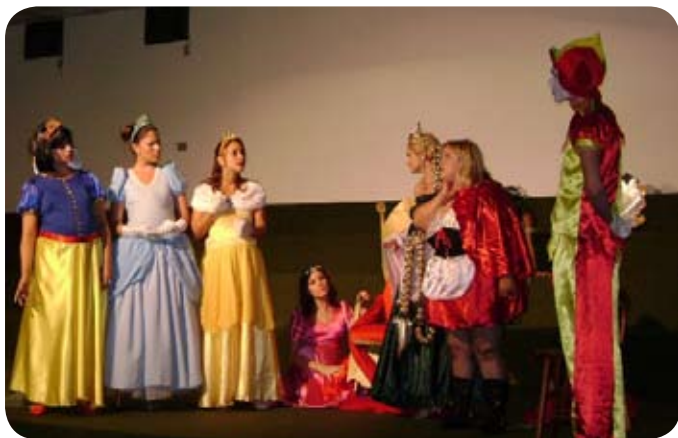
A peça encenada pelo grupo de teatro USF durante a acolhida aos novos alunos em Itatiba

A recepção aos calouros e veteranos no início do ano letivo foi marcada por ações de solidariedade e de cidadania nos quatro campi da USF. O trote solidário teve a participação ativa dos alunos, que se envolveram em ações culturais e sociais.